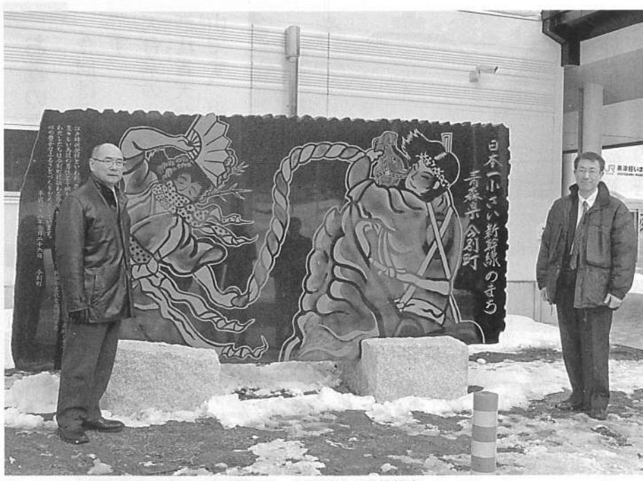
今別町・阿部町長と当社代表

みなさん、こんにちは☆ 雪の降り始めが遅かった、今シーズン。お正月休み前も雪は少なかったたので、このままいくのかと思っていたら、休みに入った途端ドカッと降ってくれました。それでも全体的な量としては少なかったようですね。 さて、霊園の状況ですが、晴れ間が増え、場所によっては雪融けが進み、竿の下の台まで見えているお墓もあります。濡れた石は非常に滑りやすいので、お墓参りは気候が落ち着くGWころまで待つてみてほしいかもかもしれません。 春号は記念碑の話題からスタートです♪